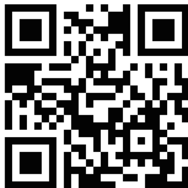
ログイン QR コード